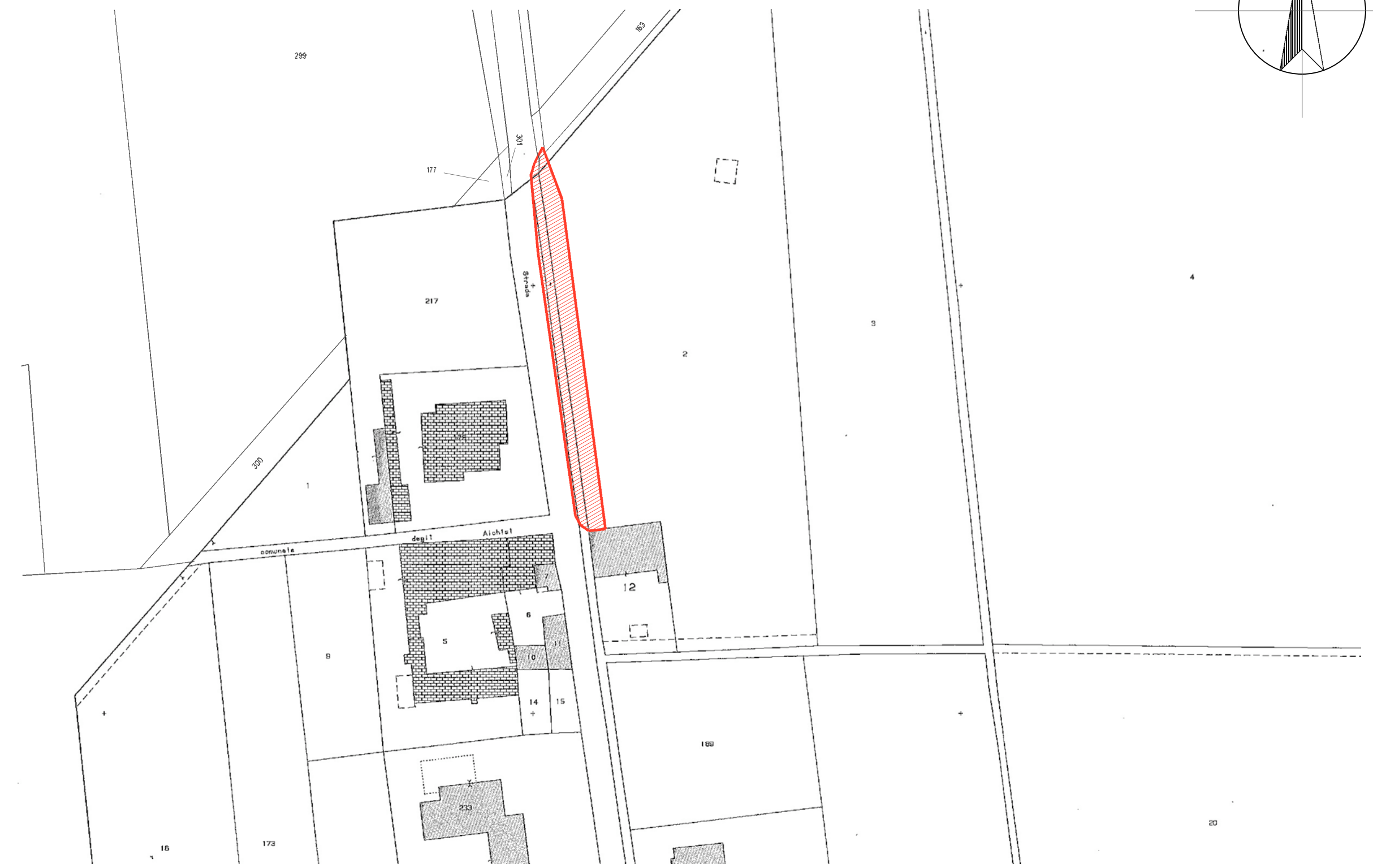
ESTRATTO DI MAPPA - Fogli 17 - 26 Scala 1:1000