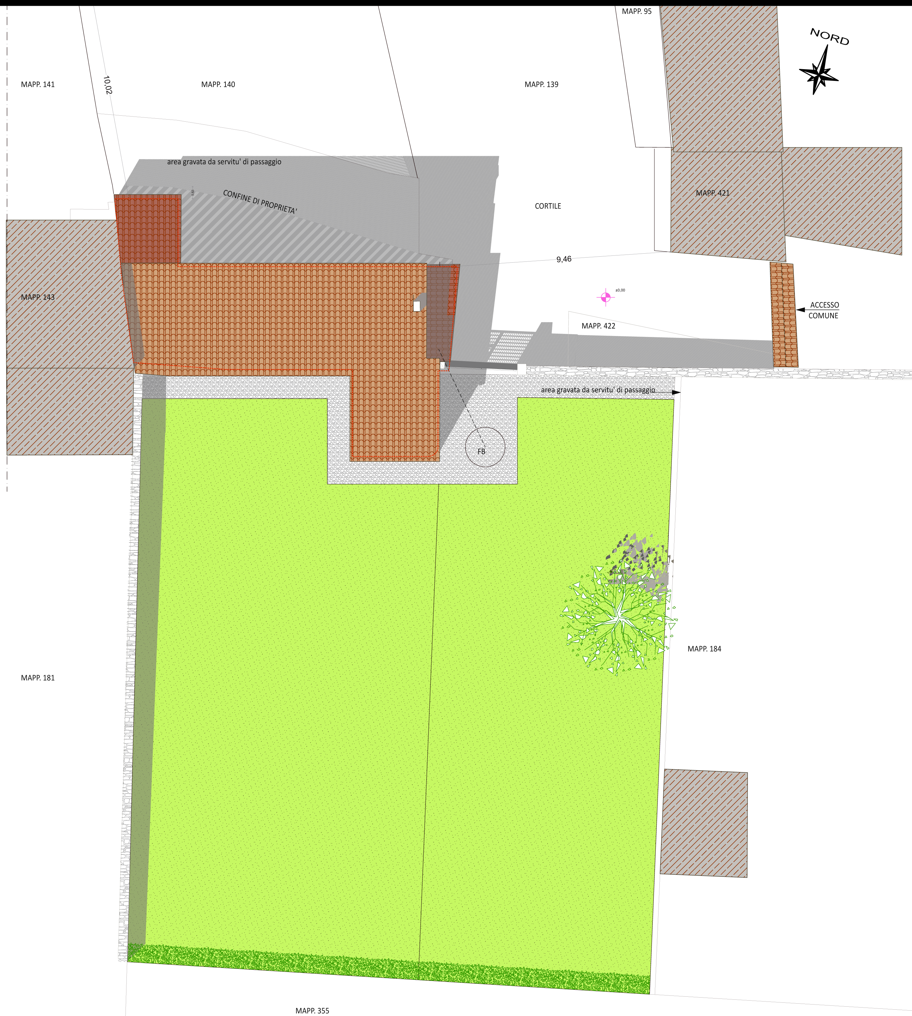
PLANIMETRIA GENERALE DI RILIEVO