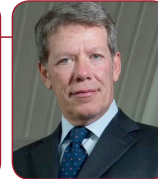
GIOACCHINO BONSIGNORE giornalista e conduttore televisivo di "Tg5 Gusto"