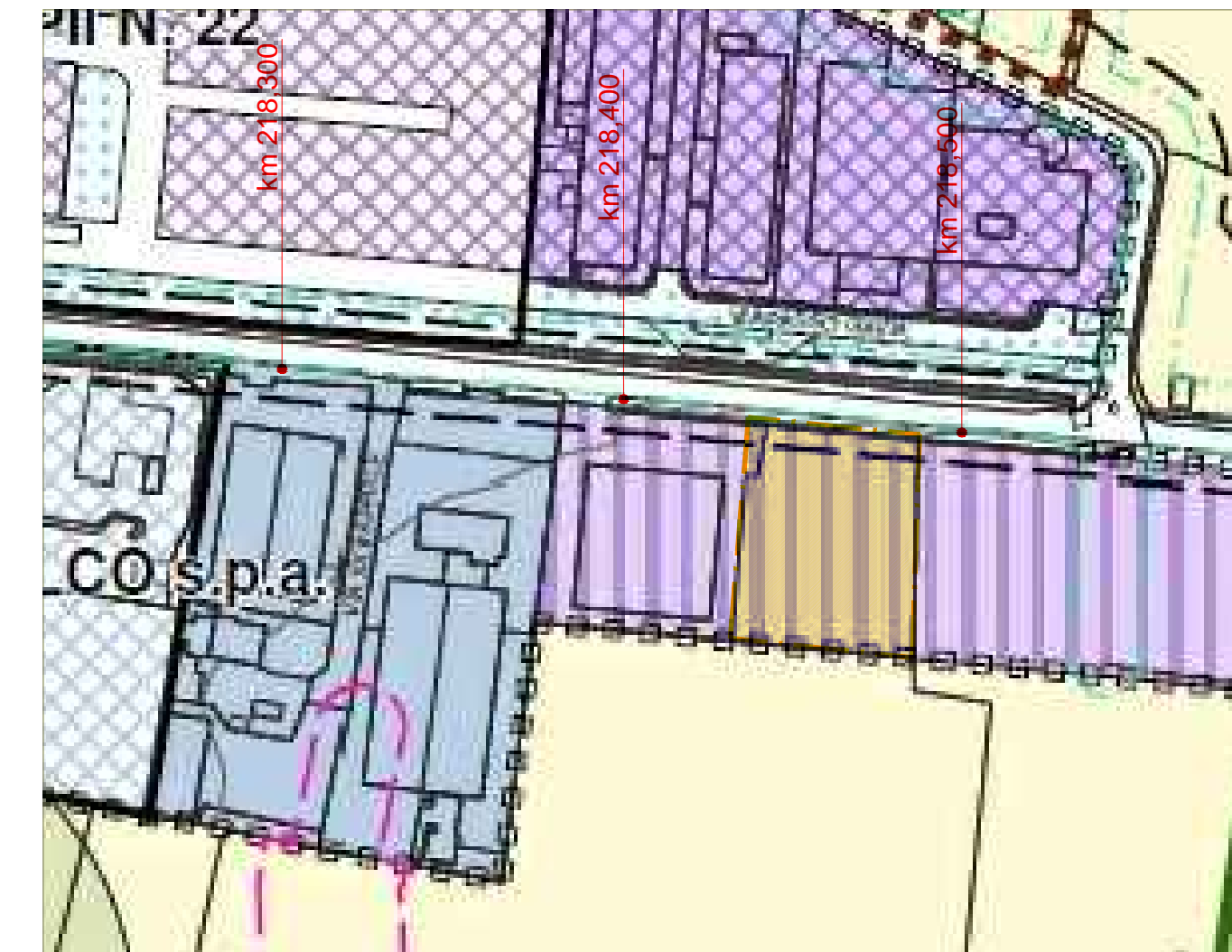
ESTRATTO P.G.T. scala 1:2000