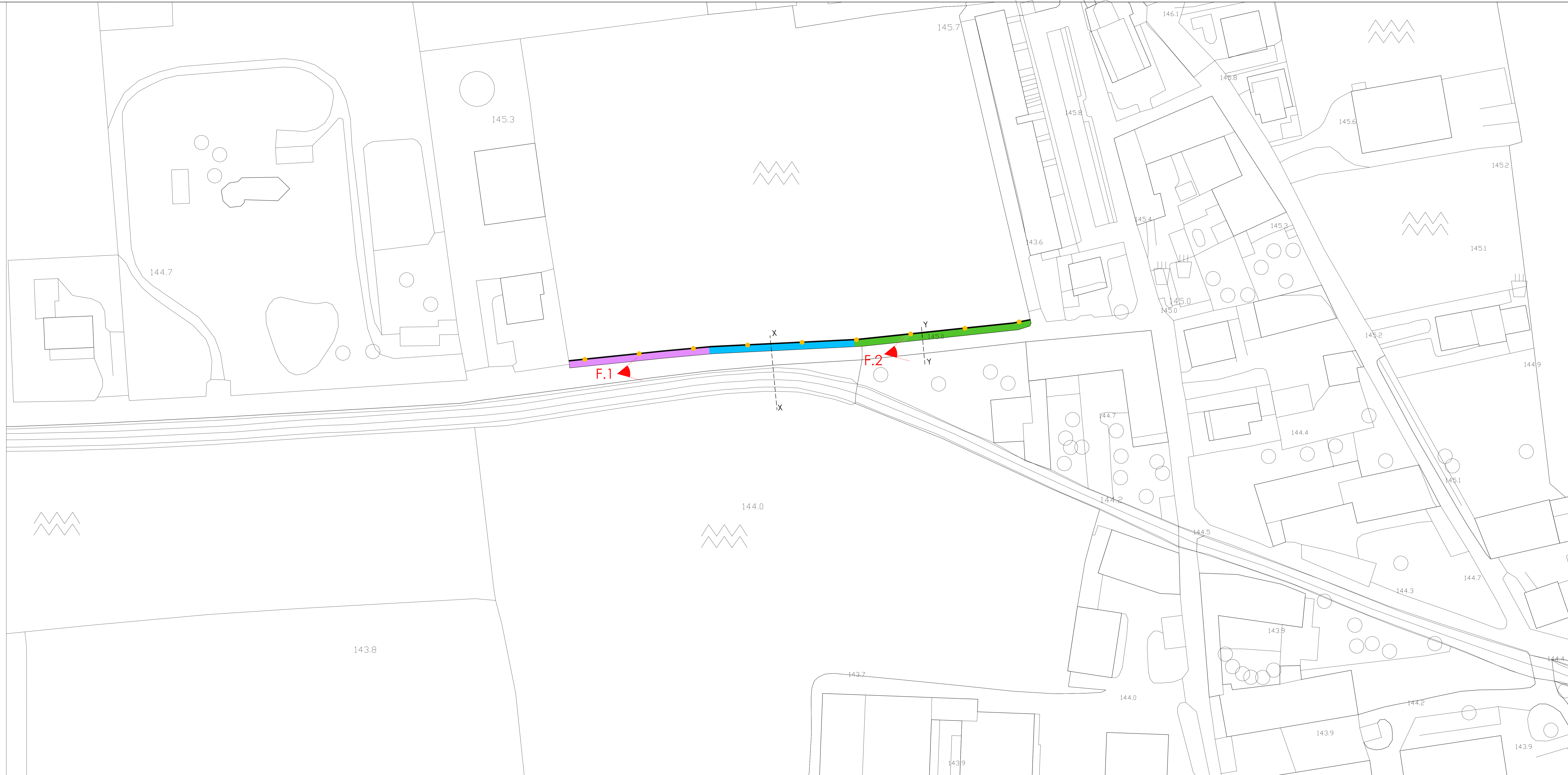
PLANIMETRIA - 1:500 -