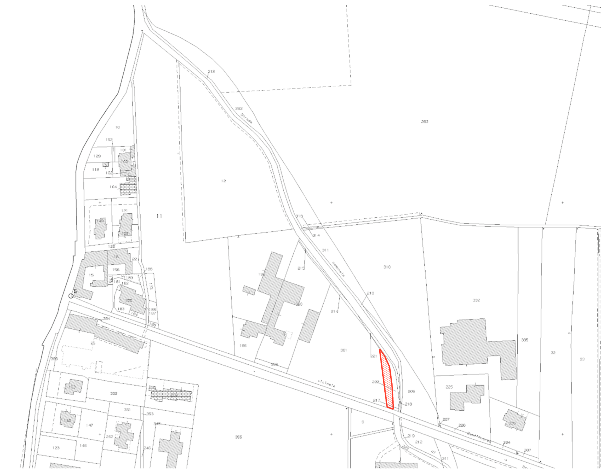
ESTRATTO DI MAPPA - Foglio 17 Scala 1:1000