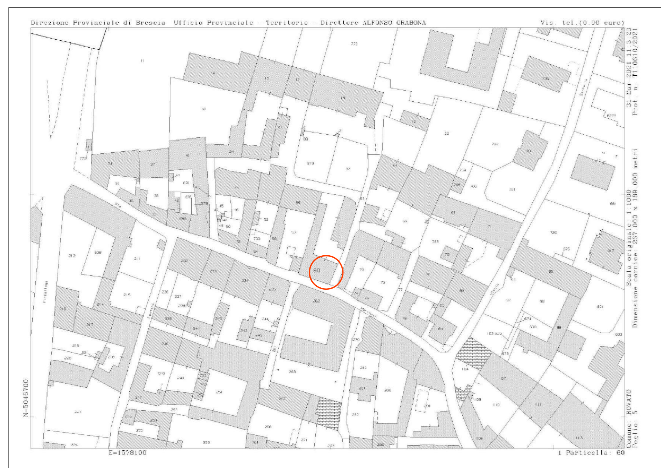
ESTRATTO MAPPA CATASTALE 1:1000