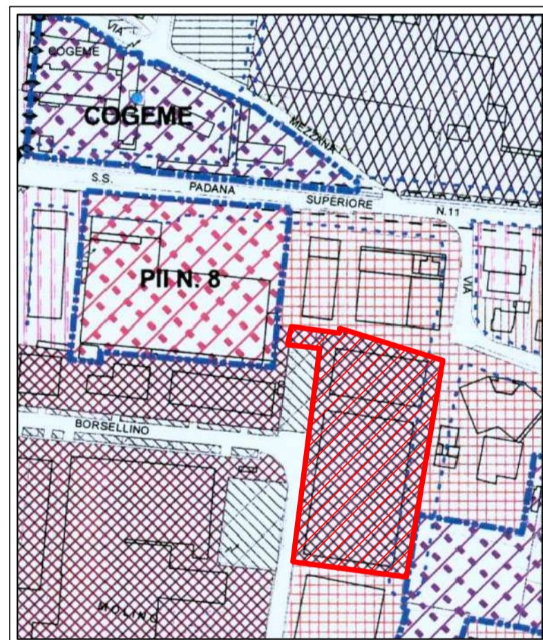
ESTRATTO P.G.T. - 1:5000 - Zona "D2" Produttivo artigianale e industriale consolidato e concluso