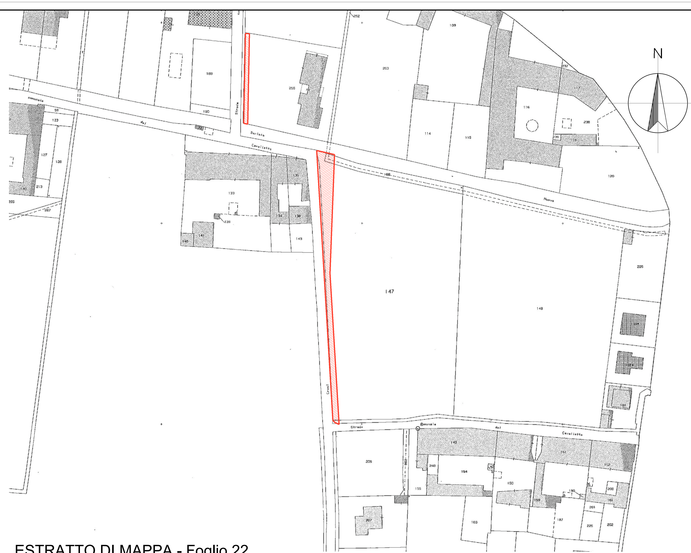
ESTRATTO DI MAPPA - Foglio 22 Scala 1:1000